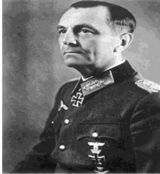
Feldmarschall Paulus (1942, Charkow,)