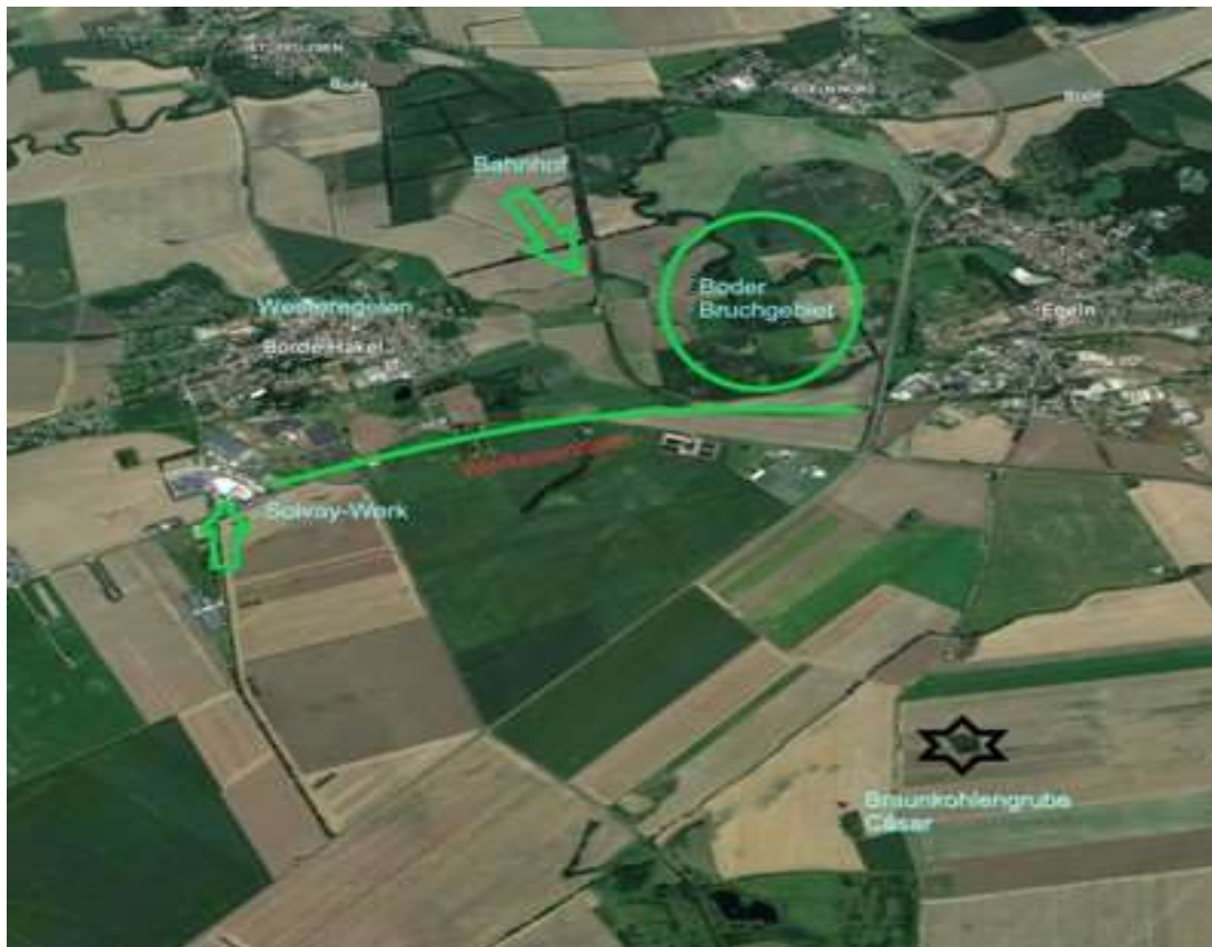
Westeregeln und Umgebung