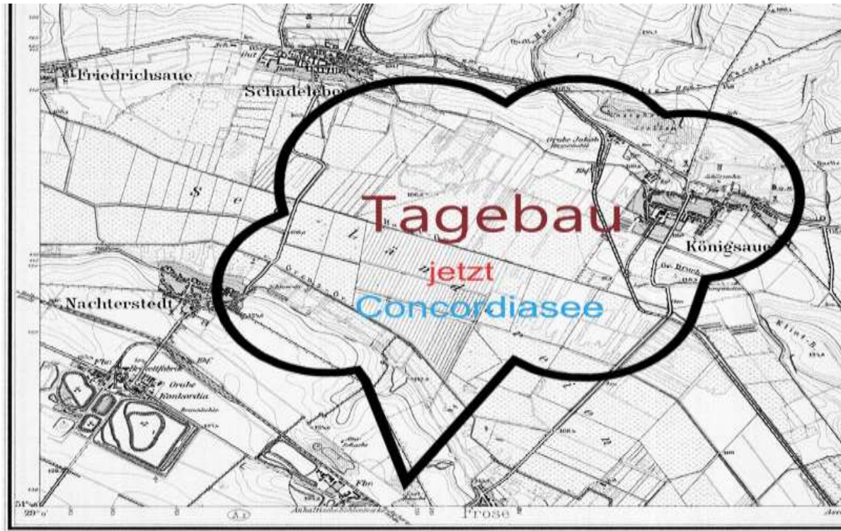
Ausschnitt aus der Karte 4134, Skizze vom Tagebau von H. Bartzack

oder vom Tagebau Königsau gewartet. Wichtig war der Braunkohlenschacht vom Cäsar. Dort war ein Stromkraftwerk.