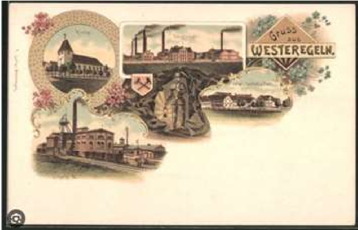
Alte Postkarte von Westeregeln mit Kirche, Werk und Schacht II