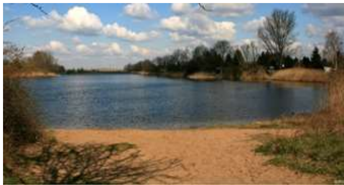
Der Kohlenpott gleich neben dem Elternhaus meiner Oma.

In der Nachkriegszeit wurde ich 1947 in Westeregeln geboren und erlebte die ersten Lebensjahre im Dorf im Bereich der heutigen Friedensstrasse. Ständig wurden wir Kinder ermahnt und überwacht, da durch die Nähe der für uns noch großen Seen der vollgelaufenen ehemaligen Kohlengruben es gefährlich war. Da meine Oma direkt nahe bei diesen kleinen Seen wohnte, durfte ich mit meinen Freunden nicht dorthin spielen gehen. Erst wenn die Oma einen schwimmen sah, konnte man da spielen gehen.